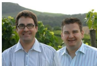
Das Winzerteam des Sonnenhofes